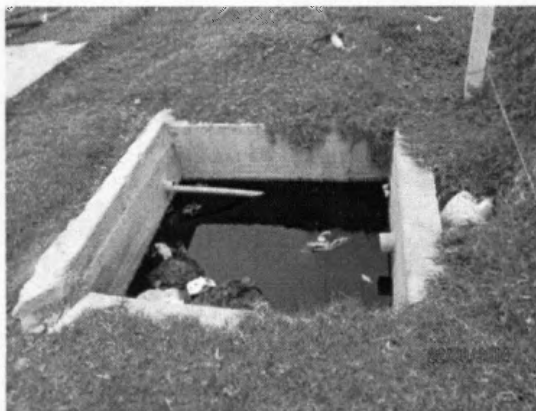
Figura 2. Piscina de recolección de lixiviado

COMITÉ DIRECTIVO VIRTUAL ACTA DE REUNIÓN No 28 – Septiembre 23 de 2014