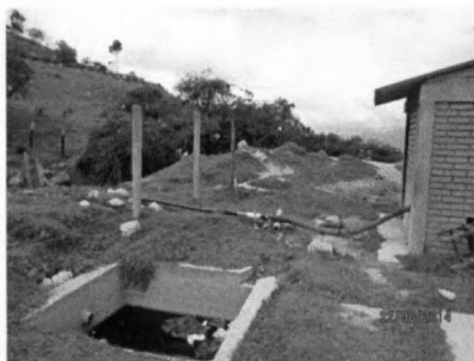
Figura 3. Descarga de los lixiviados

Se anexa la certificación de los costos de la consultoría de conformidad con lo dispuesto en el Decreto 2246 de 2012.