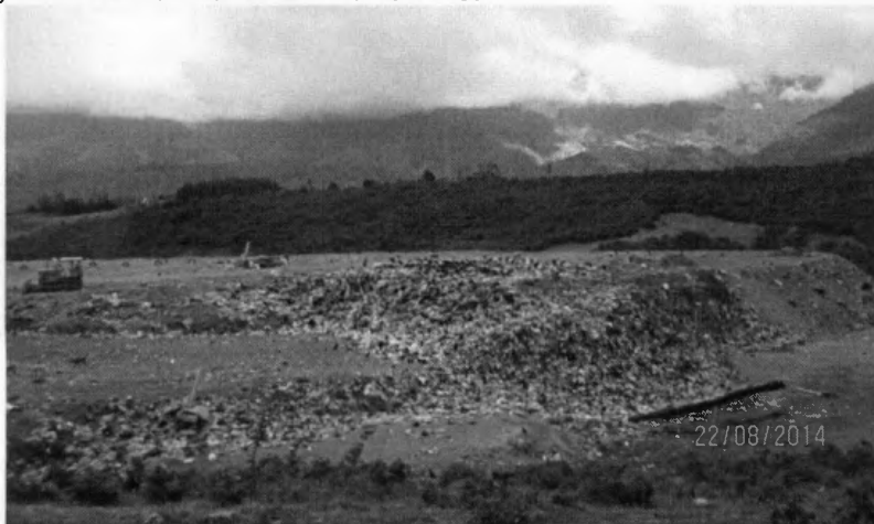
Figura 1. Disposición de los desechos en el Relleno Sanitario. Se observa maquinaria para extender los residuos para crear las terrazas. También se observa presencia de vectores como Chulos o Gallinazos

El registro fotográfico realizado al relleno sanitario es