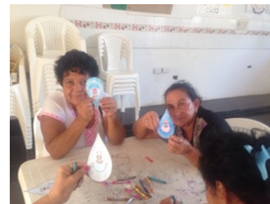
Actividad con los Adultos Mayores de la Asociación Años Dorados de Puerto Santander.