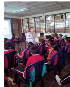
Actividad Pedagógica desarrollada con los estudiantes del Colegio Puerto Santander.

Las actividades realizadas se trabajaron desde el día 5 de Noviembre hasta el 02 de Diciembre, entre las cuales se destacan: